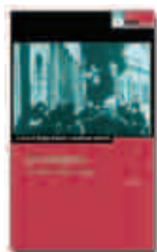
LANFRANCO CAMINITI, SERGIO BIANCHI [a cura di] «Gli autonomi - vol.1» DeriveApprodi pp. 460 Euro 25,00

UN VOLUME COLLETTIVO, PRIMO DI UNATRILOGIA, SULL'AUTONOMIA OPERAIA IL LABORATORIO DEGLI ANNI SETTANTA RACCONTATO A PIÙ VOCI